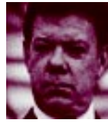
Juan Manuel Santos