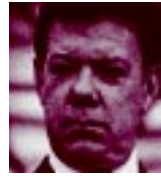
Juan Manuel Santos